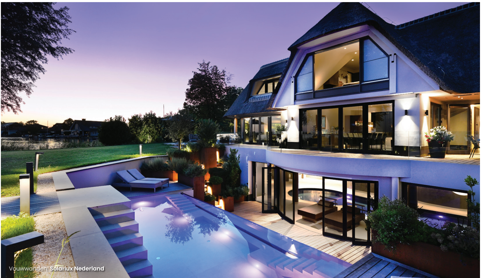
Vouwwallen: Solarlux Nederland

De rietgedekte villa met gedeeltelijk gebogen kapvorm is omgeven door een tuin met een tennisbaan en meerdere terrassen en steigers. Tijdens de verbouwing is het terrein uitgebreid met een gastenverblijf in dezelfde stijl als het hoofdhuis met een woonkamer, keuken en drie slaapkamers. "Mijn familie komt hier regelmatig logeren. De kinderen en kleinkinderen komen dan ook graag zwemmen en varen." En zo voelen niet alleen de eigenaar maar ook zijn gasten zich als een vis in het water op de schitterende locatie.