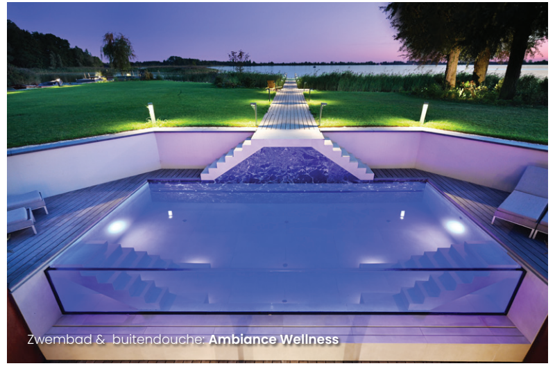
Zwembad & buitendouche: Ambiance Wellness