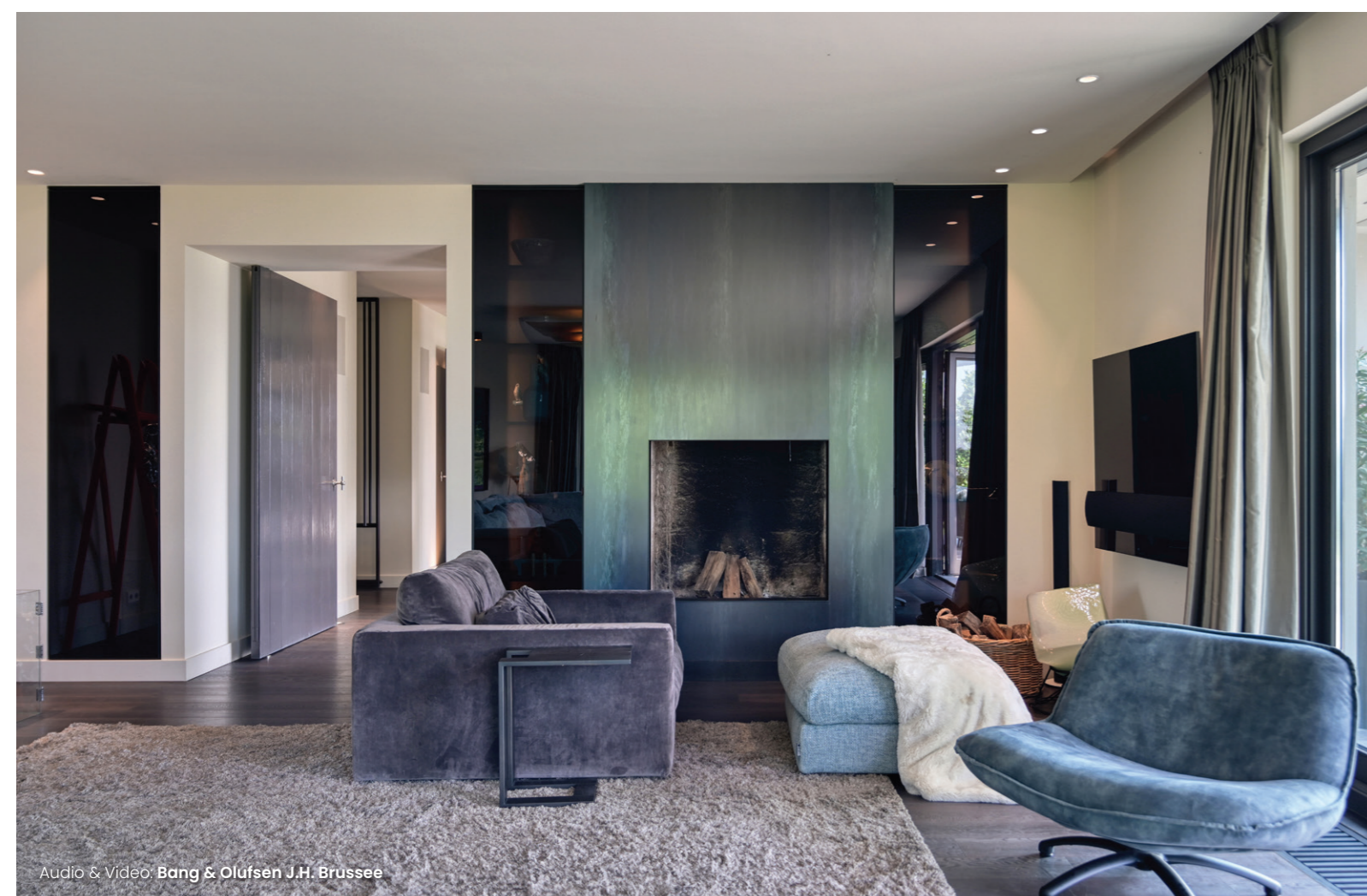
Audio & Video: Bang & Olufsen J.H. Brussee