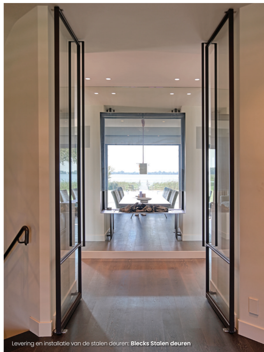
Levering en installatie van de stalen deuren: Blecks Stalen deuren

De lange gang die je via de entreehal bereikt, verbindt de woonkamer, eetkamer en woonkeuken die alle drie uitzicht over de plas hebben. De bewoner vertelt: "De ruimtes zijn overal zo veel mogelijk op buiten en op de plas georiënteerd. Dat geldt ook voor de bovenste verdieping. Als er nog geen doorzicht naar buiten was, dan is dat waar mogelijk alsnog gemaakt." Voor de inrichting koos de bewoner alleen echt hout en natuursteen. Zo is de donkere parketvloer van massief hout en zijn verschillende marmersoorten toegepast voor bijvoorbeeld de keuken, badkamers en de wellness. Voor de gestucte wanden werden neutrale kleuren gekozen. Zo komen de door de bewoner zorgvuldig uitgekozen kunstwerken - van schilderijen tot foto's en beelden - goed tot hun recht.