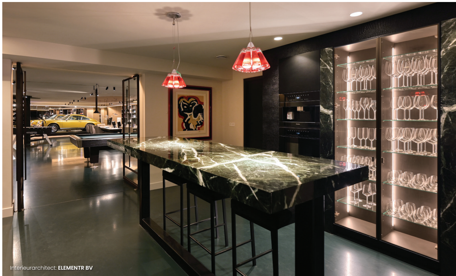
Interieurarchitect: ELEMENTR BV

In de onderste kelderverdieping is het net als in de rest van de villa goed toevoegen: hoewel de eigenaar zelf niet drinkt, is er een wijnkelder en een luxe bar. Een bibliotheek, biljartafel, een bioscoop en een ereplaats voor een collectorsitem dat via een autolift z'n weg naar buiten vindt, maken het geheel compleet. De professioneel ingerichte bioscoop met 26 boxen is dusdanig afsluitbaar dat de condities om film te kijken er ideaal zijn. Een deel van de kelder biedt plaats aan de technische installaties, waaronder de high-tech zwembad-techniek. Het onderhoud van de baden wordt, ook op afstand, door Ambiance Wellness geregeld.