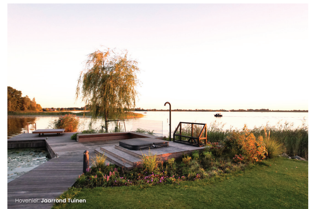
Hovenier: Jaarrond Tuinen