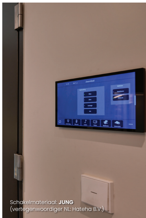
Schakelmateriaal: JUNG (vertegenwoordiger NL: Hateha B.V.)