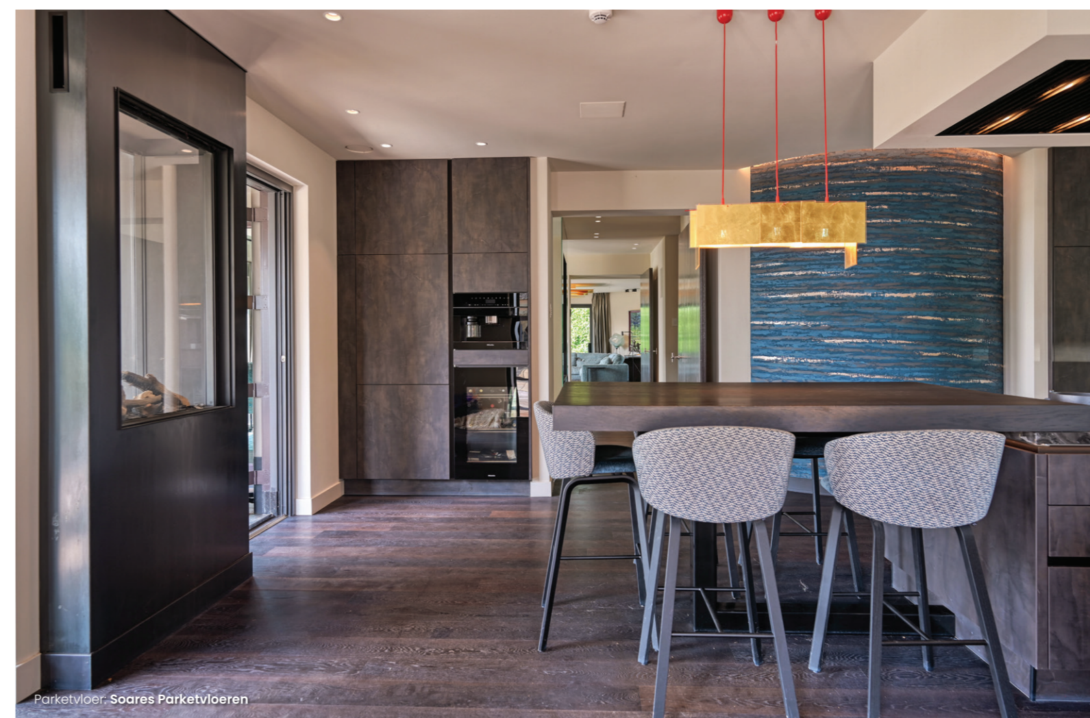
Parketvloer: Soares Parketvloeren